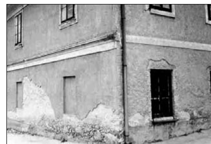
Рис. 1. Разрушение стен зданий из-за капиллярного подсоса грунтовой влаги

Горизонтальная гидроизоляция стен от капиллярного поднятия влаги выполняется компанией «Атомстрой» посредством пропитки кладки стен специальными гидрофобизирующими составами, которые заливаются в скважины, пробуренные в кладке. Эти составы, проникая из скважин в капилляры, после полимеризации покрывают стенки капилляров кладки мономолекулярным слоем жирных кислот, которые не смачиваются водой (рис. 2). Та-